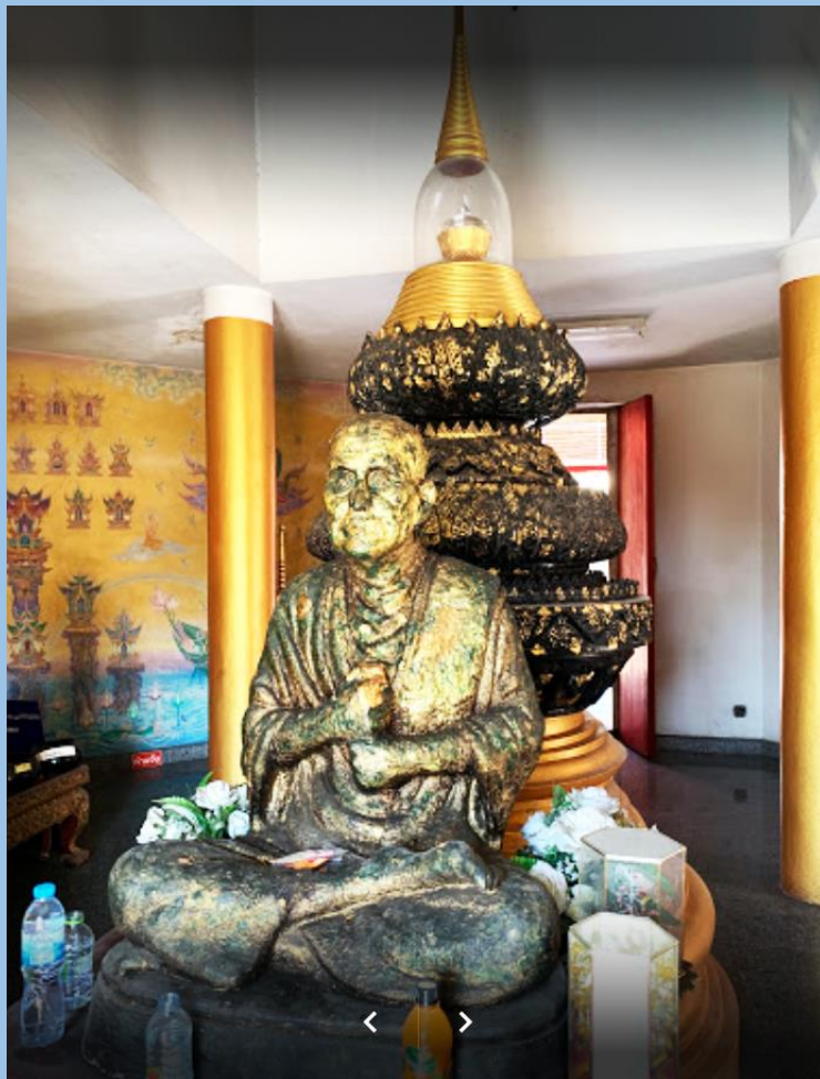
พระบรมสารีริกธาตุภายในพระเจดีย์ วัดหลักสี่