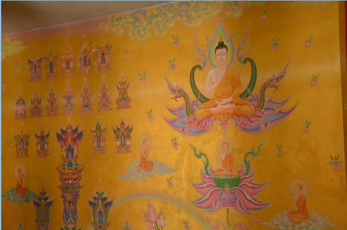
ภาพจิตรกรรมฝาผนัง เขียนโดยอาจารย์เฉลิมชัย โฆษิตพิพัฒน์ ภายในองค์พระเจดีย์บรรจุพระบรมสารีริกธาตุ