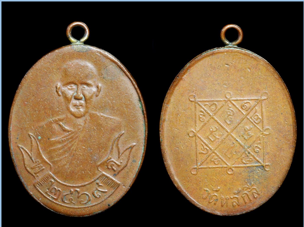
เหรียญหลวงปู่ขาว วัดหลักสี่ รุ่นแรก ปี 2469