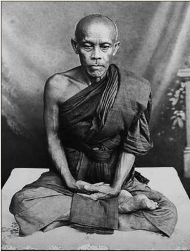
หลวงพ่อแก้ว วัดเครือวัลย์