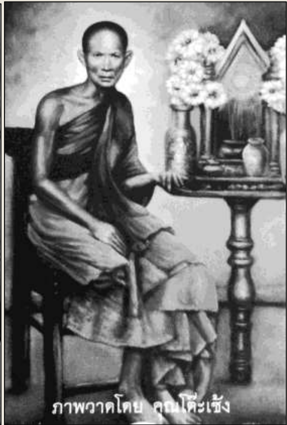
ภาพวาดโดย คุณโต๊ะเซ็ง