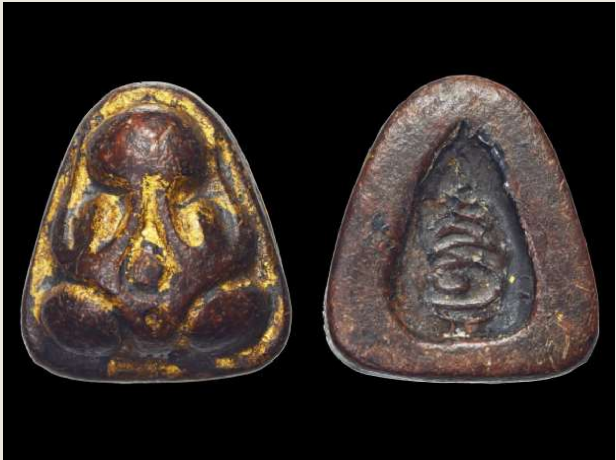
พระปิดตาหลวงปู่เจียม วัดกำแพง หลังยันต์อุ

หลังจากดำรงตำแหน่งเจ้าคณะจังหวัดอยู่ 4 ปี อาการอาพาธของท่านในท่ามกลางยุคสมัยที่ยังมีข้อจำกัดทางการแพทย์อยู่หลายประการ สุดที่จะเยียวยาแก้ไขให้ทุเลาเบาบางได้ ท่านจึงละทิ้งสังขารในวันที่ 26 พฤษภาคม (เอกสารบางฉบับ 25 พฤษภาคม) พ.ศ. 2454 แห่งรัชสมัยพระบาทสมเด็จพระมงกุฎเกล้าเจ้าอยู่หัวรัชกาลที่ 6 รวมสิริอายุได้ 56 ปี