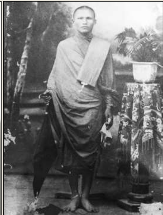
หลวงพ่อครีพ วัดสมณะ

http://www.amuletheritage.com/conten.html