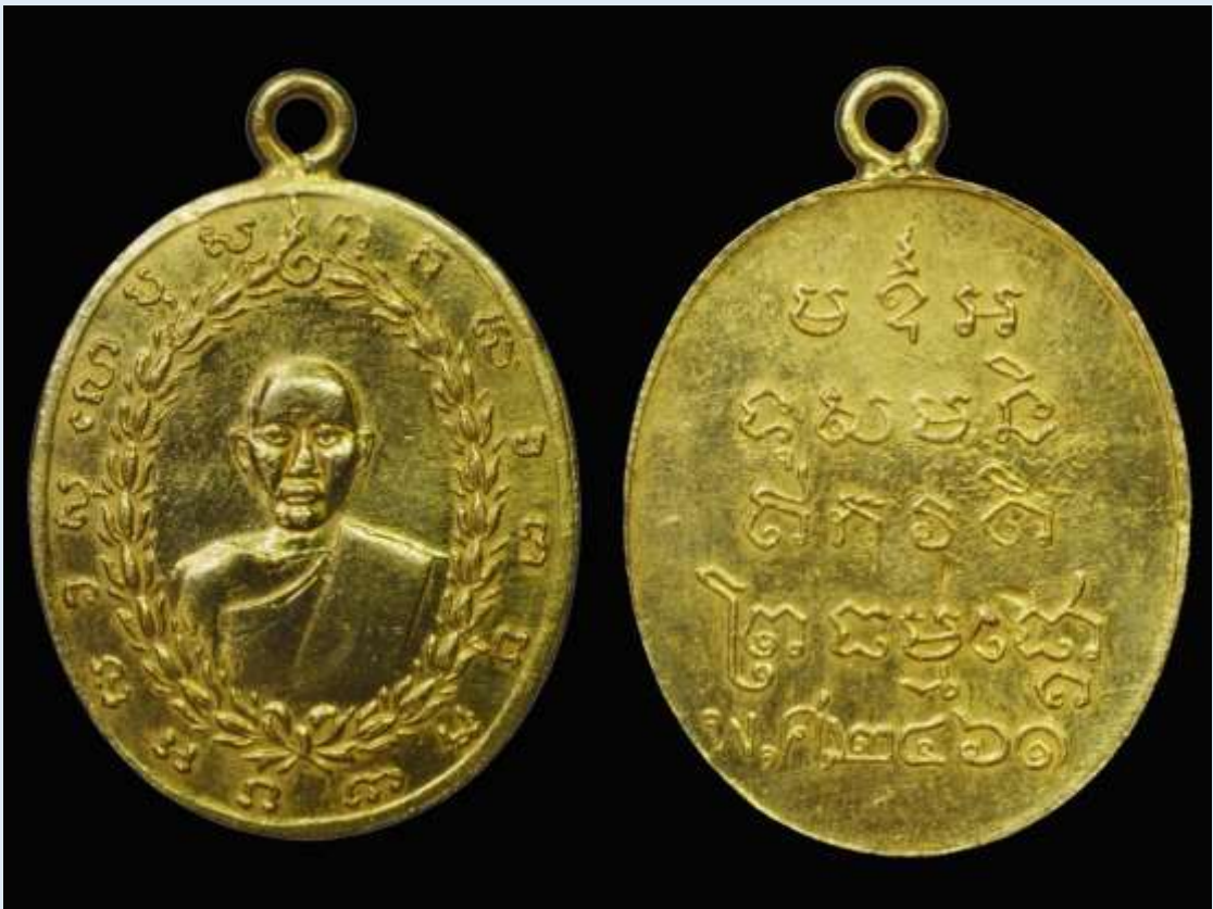
เหรียญปี่มหลวงพ่อบ้าย ปี พ.ศ. ๒๔๖๑