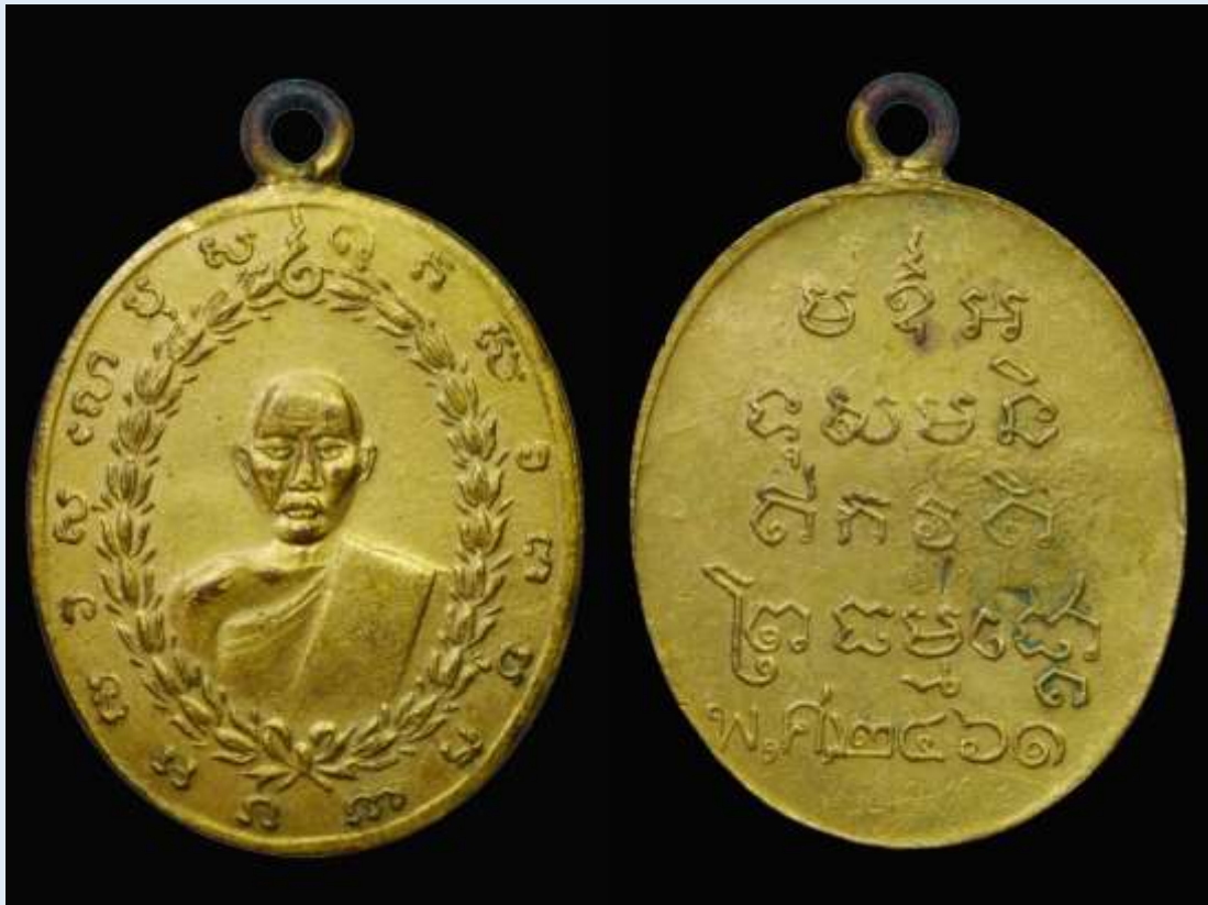
เหรียญปี่มหลวงพ่อบ้าย ปี พ.ศ. 2461