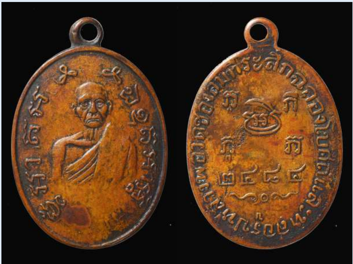
เหรียญปี่มหลวงพ่อบ้าย ปี พ.ศ. 2484