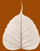
สถิตย์พันธ์ ธรรมสถิตย์

ศรีมหาโพธิ์ ไก่หรุ ดูกามตา ทรงสง่า กล้าลมแรง แกร่งเหลือไฉน เปรียบชายชาญ หาญกล้า พึงพาได้ เป็นร่มโพธิ์ ร่มไทร ให้ผองชน